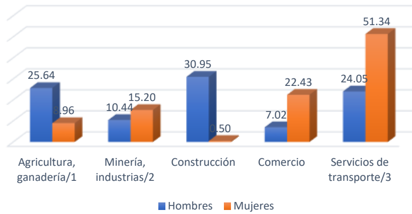
Distribución porcentual de la población según sector de la ocupación y sexo

/1 Engloban las actividades de agricultura, ganadería, aprovechamiento forestal, pesca y caza.