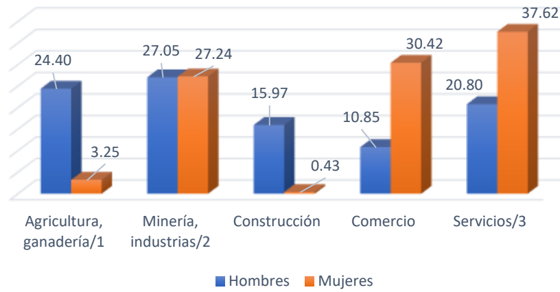
Distribución porcentual de la población según sector de la ocupación y sexo

/1 Engloban las actividades de agricultura, ganadería, aprovechamiento forestal, pesca y caza.