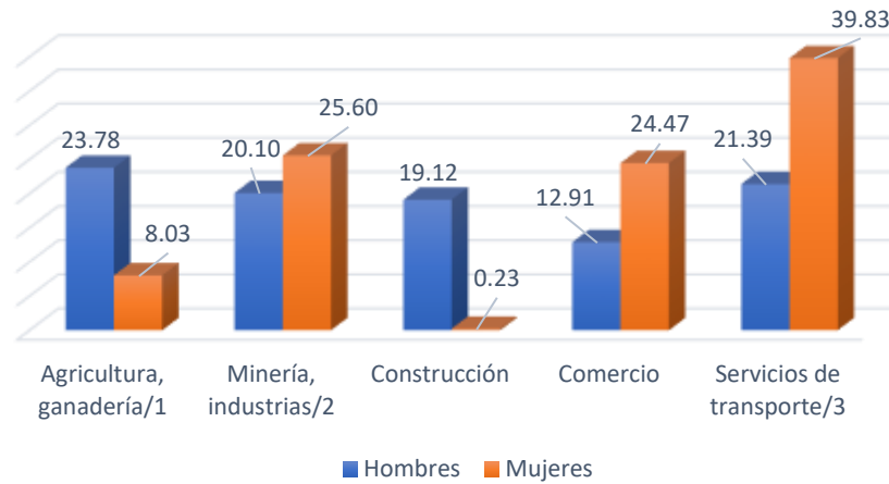
Distribución porcentual de la población según sector de la ocupación y sexo

/1 Engloban las actividades de agricultura, ganadería, aprovechamiento forestal, pesca y caza.