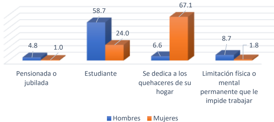
Distribución porcentual según actividad no económica desagregado por sexo