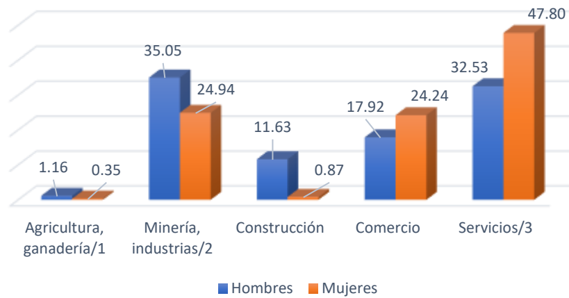
Distribución porcentual de la población según sector de la ocupación y sexo

/1 Engloban las actividades de agricultura, ganadería, aprovechamiento forestal, pesca y caza.